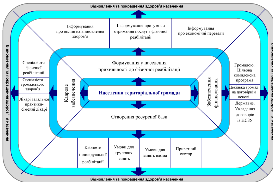
Рис. 1. Кластерна модель концептуальних підходів до забезпечення населення територіальних громад послугами із фізичної реабілітації в рамках системи громадського здоров'я

Нами розроблені концептуальні підходи до забезпечення населення територіальних громад послугами із фізичної реабілітації в рамках системи громадського здоров'я, які представлені на рис. 1 у вигляді кластерної моделі.