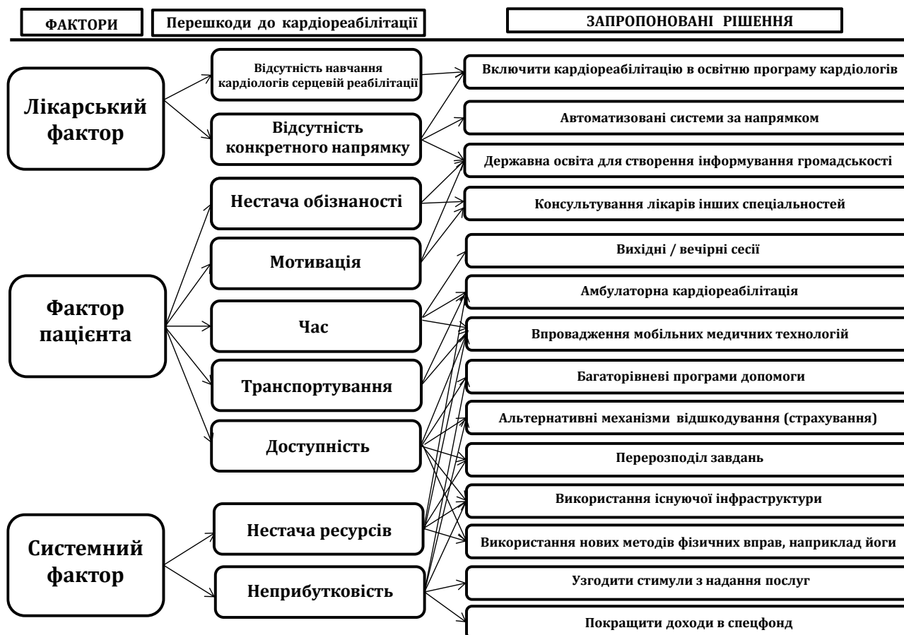
Рис. 3. Проблеми та шляхи їх розв'язання під час кардіореабілітації пацієнтів