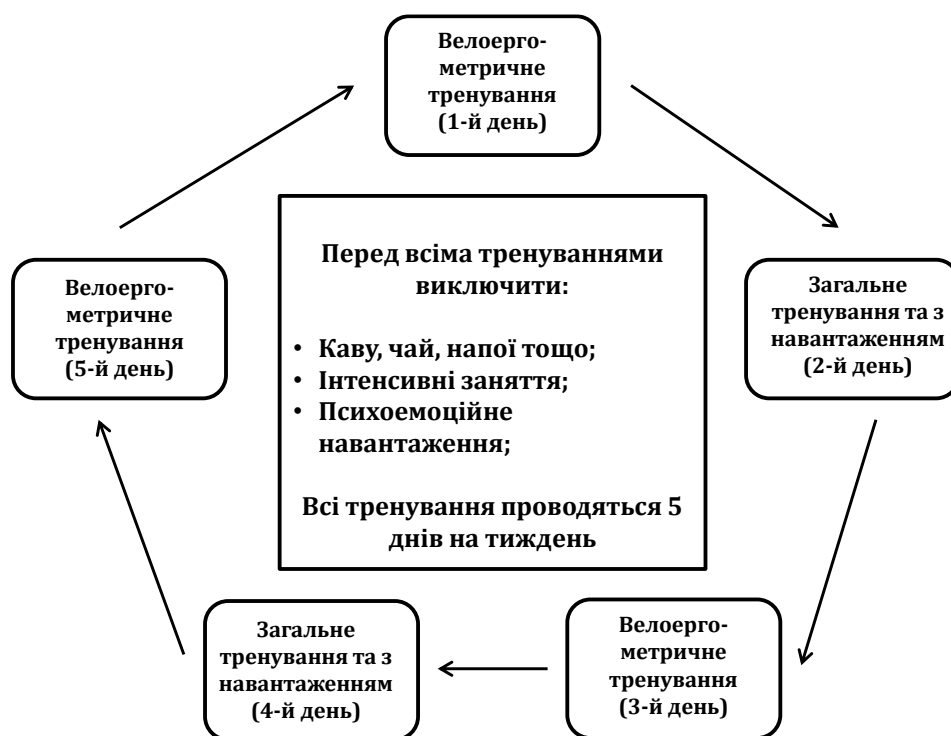
Рис. 1. Комплексний цикл програми фізичних навантажень в цілях кардіореабілітації

В програму реабілітації обов'язково включаються консультації по гіпохолестериновому харчуванню, контролю ліпідного, вуглеводного обміну, артеріального тиску, маси тіла, психологічного статусу, позбавлення шкідливих звичок та соціально-побутової поведінки.