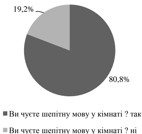
Рис. 2. Відсотковий розподіл респондентів за здібністю чути шепітну мову

Суб'єктивну оцінку зору проводили за наступними питаннями (рис. 3): чи добре впізнаєте обличчя з відстані 6 метрів (82,7% так, 17,3% ні), можете прочитати звичайний текст без окулярів (94,2% так, 5,8% ні), добре бачите на відстані без окулярів (71,2% так, 8,8% ні).